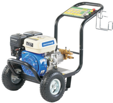
GPW2700 / GPW3200 / GPW3600