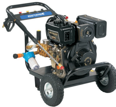
DPW2700 / DPW3600