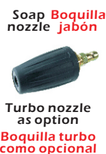
Turbo nozzle as option Boquilla turbo como opcional