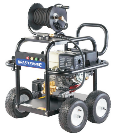
GPW3600E-4 / DPW3600E-4